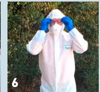
6 Zet je veiligheidsbril op