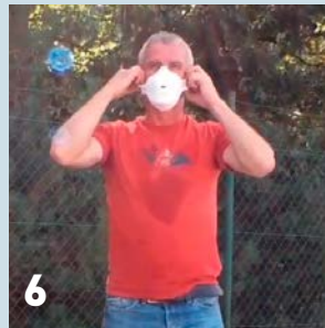
6 Zet het mondmasker en de bril af