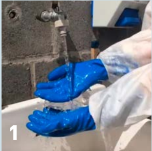
1 Spoel je handschoenen

Het is van belang dat je jouw persoonlijke beschermingsmiddelen veilig uittrekt.