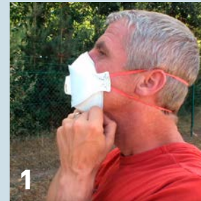
1 Zet het mondk masker op. Zorg dat het masker goed aansluit, ook aan je neus (brug)