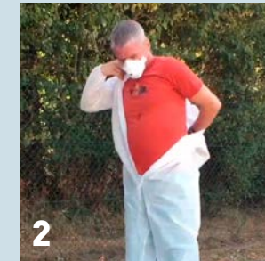
2 Trek de overall aan