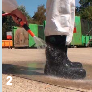
2 en de laarzen af