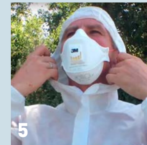
5 Trek de kap over je hoofd