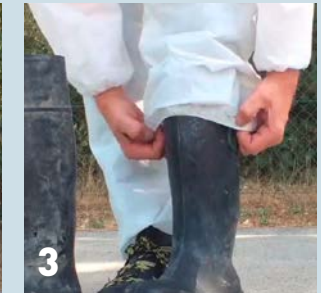
3 Zorg dat de overall goed over je laarzen komt