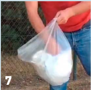
7 Steek alles in een dubbel plastic zak. Draai de plastic zak dicht en vouw het opgedraaid stuk dubbel (zwanesluiting) en plak dit goed dicht.