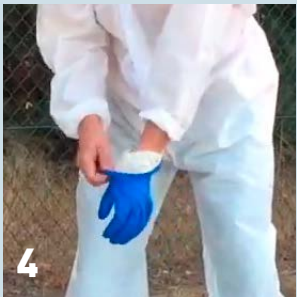
4 Doe de handschoenen uit