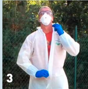
3 Rits de overall open